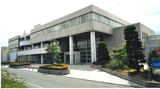
テクノプラザ愛媛